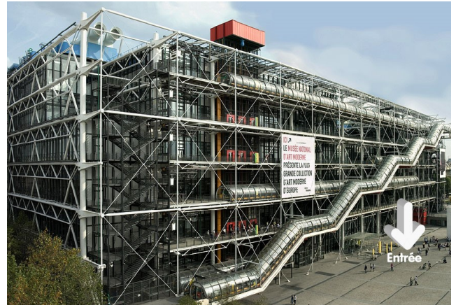
Le centre Pompidou

Sa construction a démarré le 28 janvier 1887. Il a fallu 3 ans (1884-1887) pour concevoir la Tour Eiffel et 2 ans 2 mois et 5 jours (1887-1889) pour la construire.