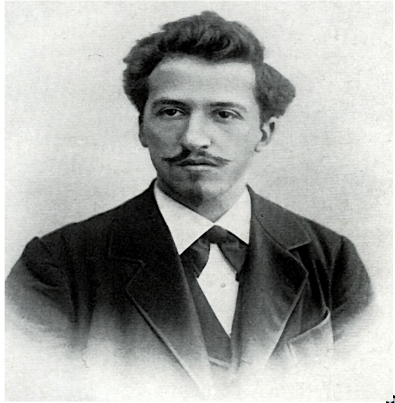
Piet Mondrian en 1899

Nom de naissance : Pieter Cornelis Mondrian