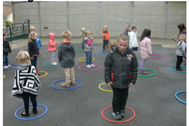
Le jeu des cerceaux