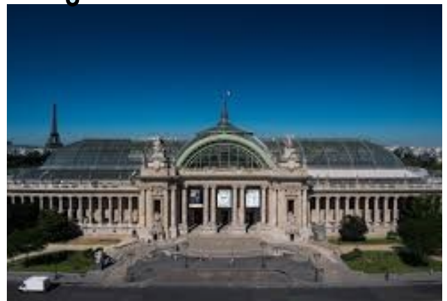
Le Grand Palais