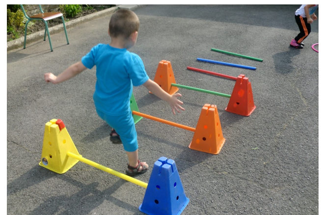
Parcours de motricité