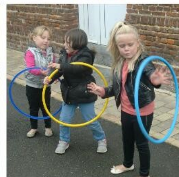
Les ateliers du cirque